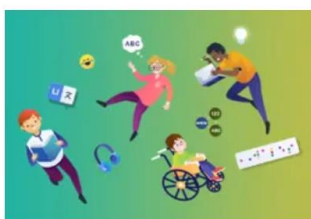
Ieithoedd, Llythrennedd a Chyfathrebu