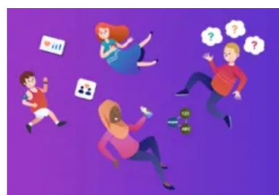
Iechyd a Lles