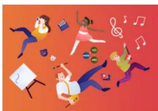
Y Celfyddydau Mynegiannol