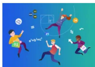
Mathemateg a Rhifedd